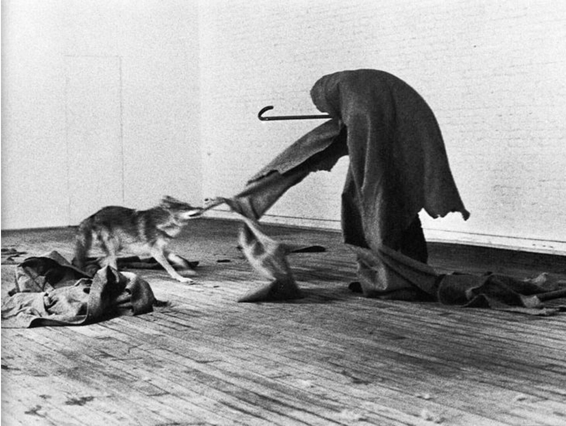
JOSEPH BEUYS_I LIKE AMERICA AND AMERICA LIKES ME