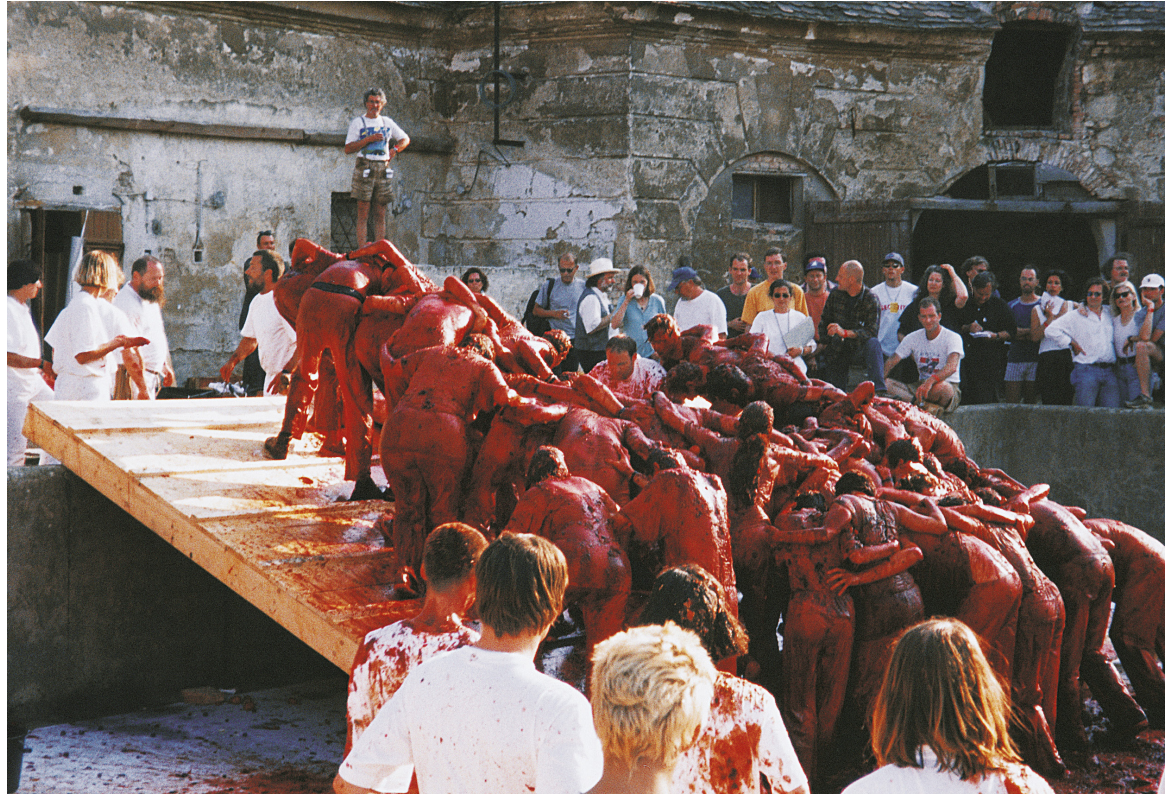
HERMANN NITSCH_ORGIEN MYSTERIEN THEATRE