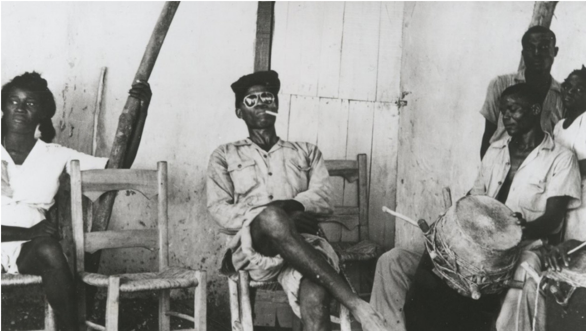
MAYA DEREN_DIVINE HORSEMAN