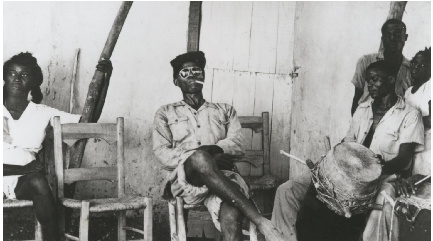
MAYA DEREN_DIVINE HORSEMAN