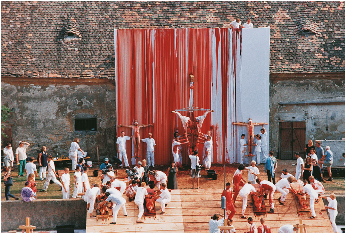
HERMANN NITSCH_ORGIEN MYSTERIEN THEATRE