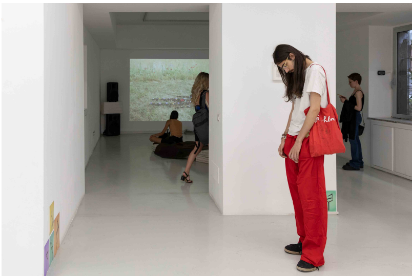
La Famiglia delle Xeniaforme, Gli Effetti.

In conclusione il talk "Tutto l'Essenziale. Spazio, Finzione, Linguaggio" è una indagine erratica, ironica, paradossale, sulle possibilità teoriche e pratiche delle discipline "Tecniche performative per le arti visive" e "Installazioni multimediali" partendo dall'opera informale di John Cascone.