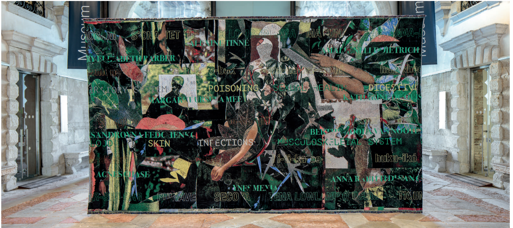
La desinenza estinta . Tessuto jacquard effetto lampasso di trame, 300 x 500 cm. Installazione Ca' Pesaro Galleria Internazionale d'Arte Moderna, Venezia.