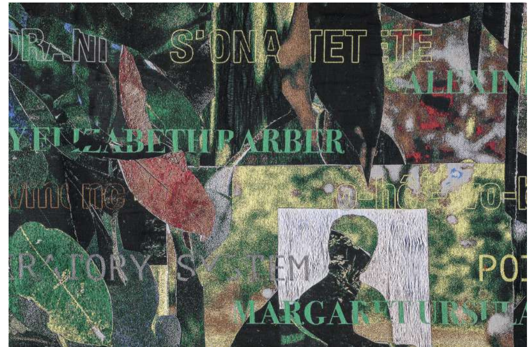
La desinenza estinta. Tessuto jacquard effetto lampasso di trame, 300 x 500 cm. Dettaglio.

La seconda parte sarà dedicata alla conversazione e al confronto con gli studenti.